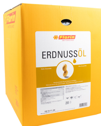
5653 FLORIN Erdnussöl 20L Herkunft Schweiz CHF 89.00 / BiBox