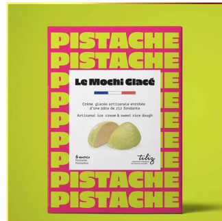
8513 TILIZ Mochi Pistachio 12x210gr ( 6x35gr Pack ) Herkunft Frankreich