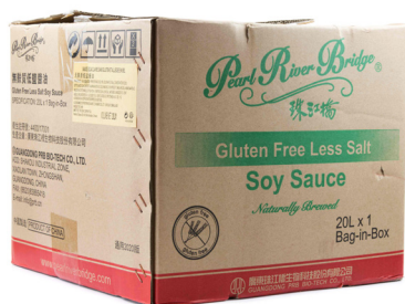
3495 PRB Sojasaucenzubereitung salzreduziert & glutenfrei / 20L Herkunft China CHF 41.65 / BiBox