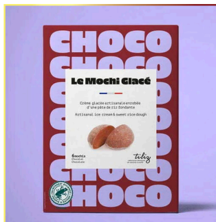
8512 TILIZ Mochi Chocolate 12x210gr ( 6x35gr Pack ) Herkunft Frankreich