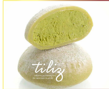
8509 TILIZ Mochi Matcha Tea 45x35gr flow pack Herkunft Frankreich