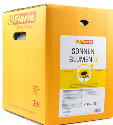
5657 FLORIN Sonnenblumenöl 20L Herkunft Schweiz CHF 69.00 / BiBox