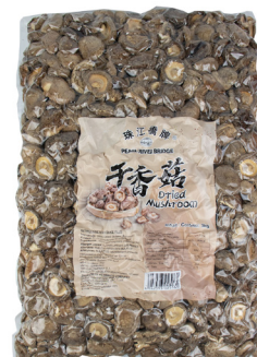
4862 PRB Shitake Pilze getrocknet 4x3kg Herkunft China CHF 275.00 / Karton CHF 68.75 / Sack