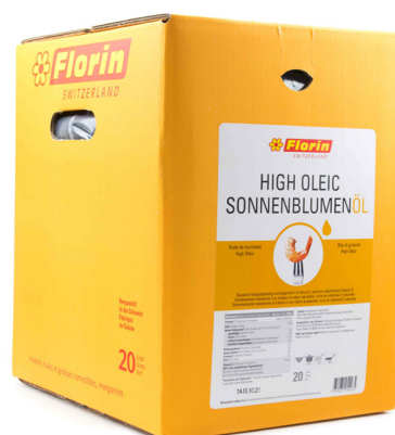
5661 FLORIN High Oleic Sonnenblumenöl 20L Herkunft Schweiz CHF 79.00 / BiBox