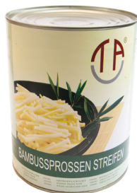
5001 TAC Bambussprossen Streifen 6x2950gr Herkunft China