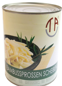
5000 TAC Bambussprossen Scheiben 6x2950gr Herkunft China