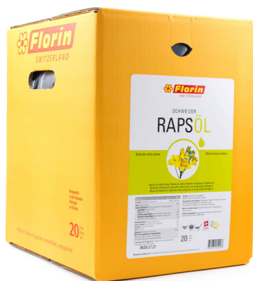
5650 FLORIN Rapsöl 20L Herkunft Schweiz CHF 79.00 / BiBox