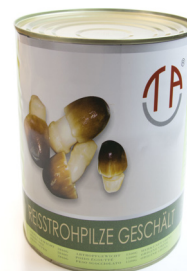
5152 TAC Reisstrohpilze ganz geschält 6x2950gr Herkunft China