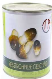
5151 TAC Reisstrohpilze ganz geschält 12x850gr Herkunft China