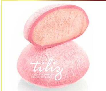
8508 TILIZ Mochi Sakura 45x35gr flow pack Herkunft Frankreich