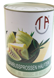
5002 TAC Bambussprossen Hälften 6x2950gr Herkunft China