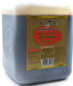
3489 PRB Superior Sojasauce hell 2x8L Herkunft China CHF 34.00 / Karton CHF 17.00 / Bidon