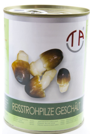
5150 TAC Reisstrohpilze ganz geschält 24x425gr Herkunft China