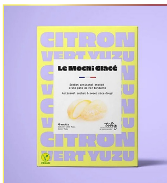
8515 TILIZ Mochi Yuzu & Lime VEGAN 12x210gr ( 6x35gr Pack ) Herkunft Frankreich