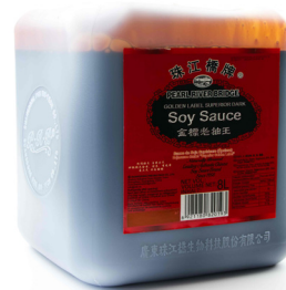
3493 PRB Superior Sojasauce dunkel 2x8L Herkunft China CHF 38.50 / Karton CHF 19.25 / Bidon