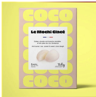
8510 TILIZ Mochi Coconut 12x210gr ( 6x35gr Pack ) Herkunft Frankreich